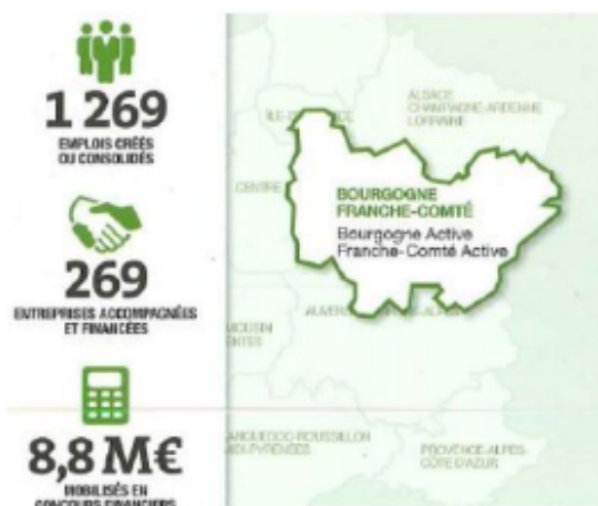
Action de France Active Bourgogne et France Active Franche-Comté en 2015

Leur capacité démontrée à innover (Emergence, Fonds de Confiance, Dasess, Cap jeunes, Made In bloc...) et à trouver au quotidien les moyens de soutenir l'initiative et construire des partenariats, va de plus en plus leur permettre de déployer leurs ressources au côté des dynamiques des territoires. Nous allons amplifier notre capacité à susciter l'initiative, soutenir la construction de projet, financer la création, le développement, ou la consolidation d'entreprises solidaires.