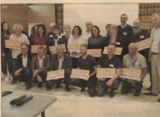
Le FAPE EDF récompense des structures qui favorisent l'insertion professionnelle.

17 projets de qualité ont ainsi été sélectionnés, tous ancrés sur le territoire avec des profils aussi différents qu'une épicerie solidaire, un jardin d'insertion qui alimente les cantines scolaires, des tailleurs de pierre à Bèze... « Ils sont obligés d'être au service du ter-