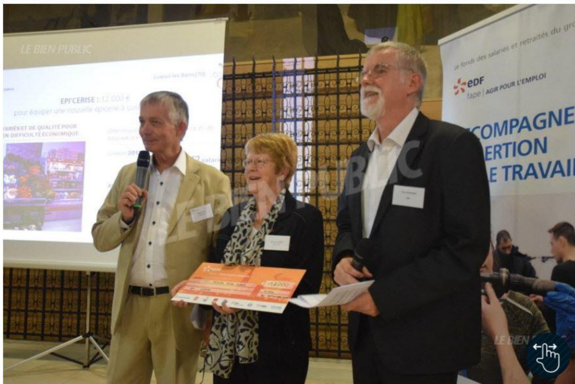
■ Épi'Erise, de Luxeuil-les-Bains (70) a reçu 12 000 euros pour équiper une nouvelle épicerie dans la commune.

Vu 1806 fois | Le 26/09/2018 à 19:43 | mis à jour à 19:44 | Réagir [1]